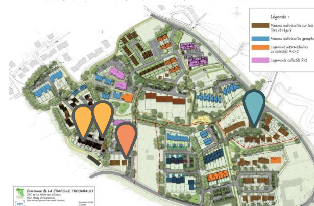
Commune de LA CHAPPELLE THOUARULT DUC de la Vierge aux Oiseaux Plan d'occupation des sols Document d'urbanisme Révisé 2014