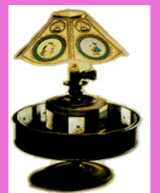
Le Praxinoscope (1877)

De nombreuses inventions qui ont contribué à la naissance du septième Art : le cinéma !